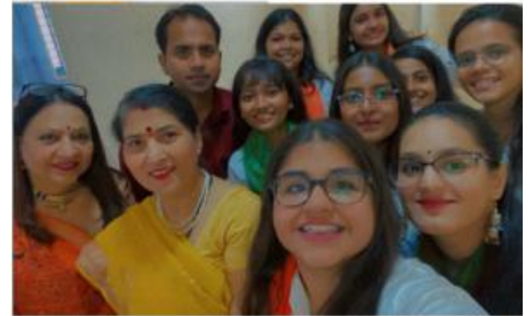
Bharati College 2021-22 Music Department

One day symposium on "Inculcating Values and Professional Ethics among Youths"