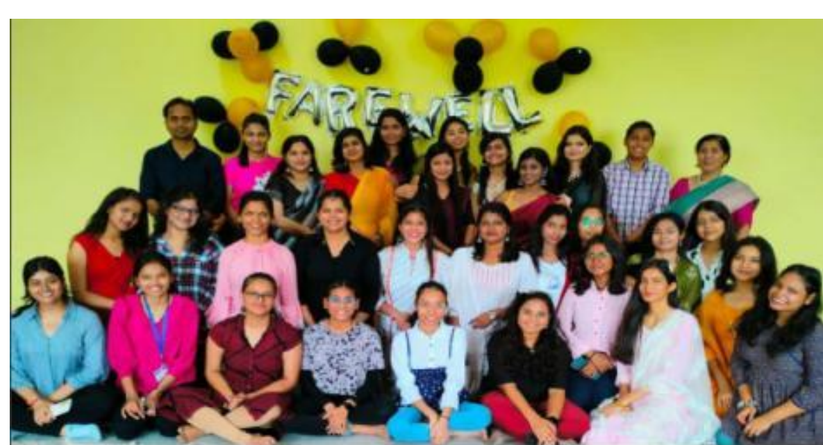
Music Department Farewell 2022-23