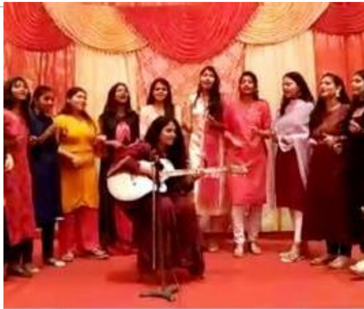
Bharati College 2021-22 Music department freshers