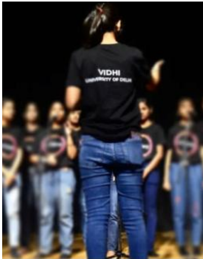
NAAC Event 2021-2022