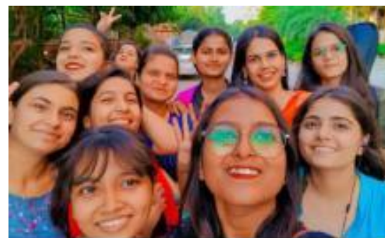
Music Department Students