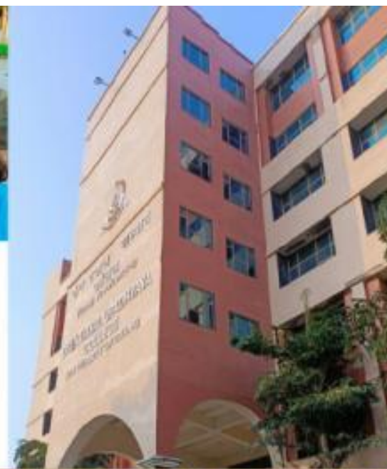
Deendayal Upadhyaya College Competition 2022-23